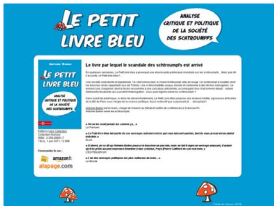
Le petit livre bleu (2011) www.lepetitlivrebleu.com